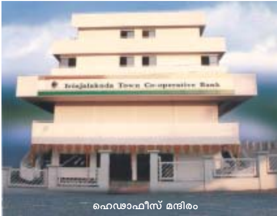
ഹെഡ് ഓഫീസ് മന്ദിരം